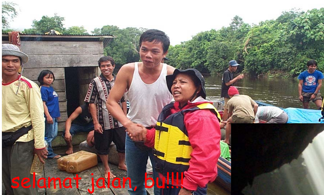
selamat jalan, bu!!!