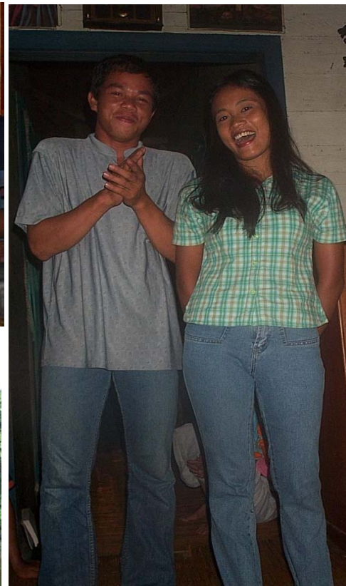
Sri ... kapan kowe bali??