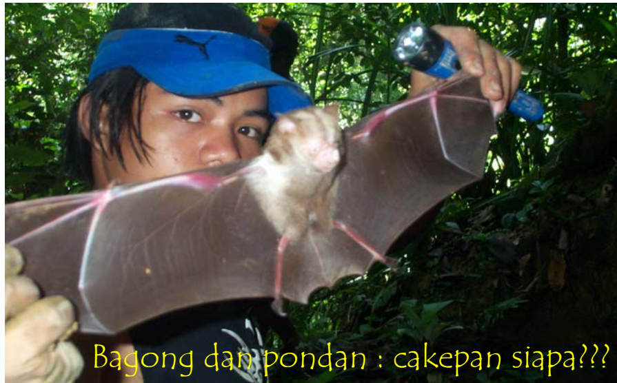
Bagong dan pondan : cakepan siapa???