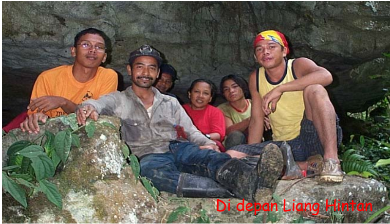
Di depan Liang Hintan