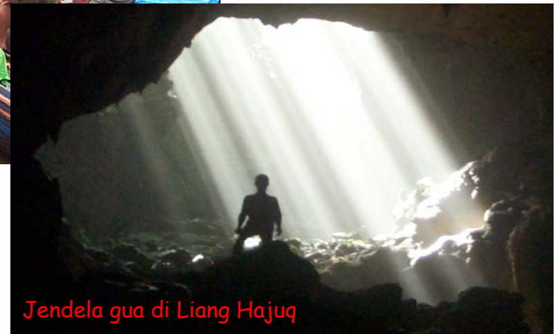
Jendela gua di Liang Hajuq

Ekspedisi Muller, 4-29 Juni 2004 Lembaga Ilmu Pengetahuan Indonesia-Bogor