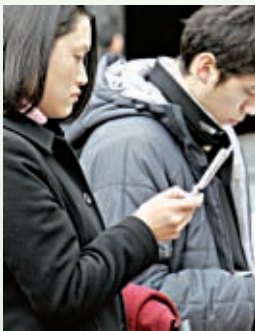
➔ Ponsel publik

8 Untuk kondisi tertentu, publik juga dapat mengakses data terbaru dari hasil pengukuran. Caranya, publik diberi satu nomor akses khusus.